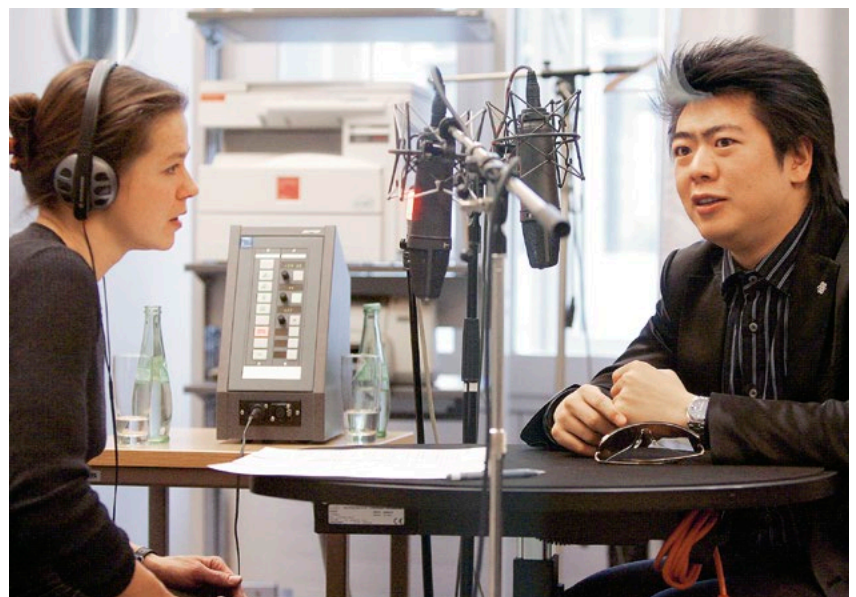
Der chinesische Ausnahmepianist Lang Lang gibt der WDR 3-Sendung »Resonanzen« ein Live-Interview

»Der WDR ermöglicht Zugang zu Kultur und Diskursen und schafft eine Verbindung zwischen Kultur, Gesellschaft und Religion. Das ist unser gesellschaftlicher Auftrag.«