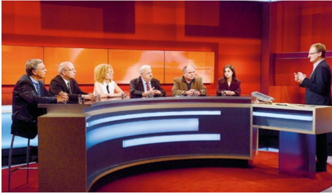
Experten diskutieren in der Sendung »Hart aber fair« über Flüchtlinge in Deutschland

Der WDR ist der größte Zulieferer im Senderverbund der ARD.