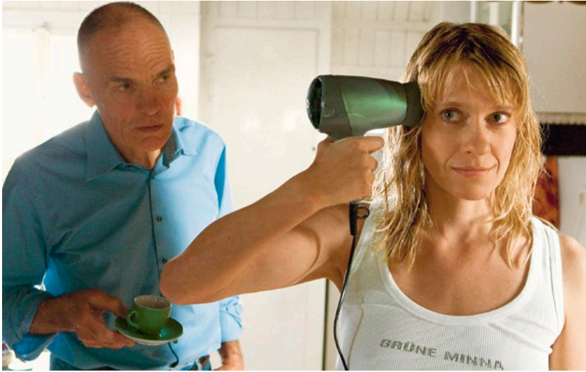
Sophie Haas (Caroline Peters, rechts), Kommissarin bei »Mord mit Aussicht«, ist anderer Meinung als ihr Vater Hannes Haas (Hans Peter Hallwachs)