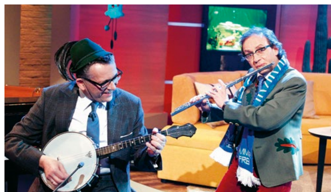
Wigald Boning (rechts) macht gemeinsam mit Götz Alsmann bei »Zimmer frei!« Musik

»Der WDR unterhält über die Grenzen von Generationen und Kulturen hinweg. Dabei sind alle Programme und Sendungen der Bewahrung der Menschenwürde verpflichtet, ohne Mobbing, Ekel und Prangerformate.«