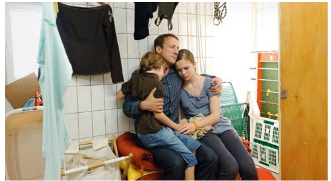
»Der letzte schöne Tag« zeigt eine Familie, die mit der Trauer über den Freitod der Mutter leben muss

Kultur braucht Schutz. Wir wollen die Plattform sein, auf der die Menschen in Nordrhein-Westfalen Kultur in allen Spielarten erfahren und genießen können. Mit unseren Sendungen und Veranstaltungen gewährleisten wir Teilhabe an der kulturellen Weiterentwicklung und schaffen so bezahlbare Kultur für alle. Wir machen Kultur zugänglich und verständlich, sorgen also für »kulturelle Barrierefreiheit«. Neugier wird auch in Zukunft genügen. Kulturelle und gesellschaftliche Zusammenhänge werden immer vielfältiger und komplexer; wir haben als öffentlich-rechtlicher Rundfunk die Erfahrung und Kompetenz, Orientierung zu bieten, Neues aufzuspüren und vor allem: Bedeutendes von Banalem zu trennen.