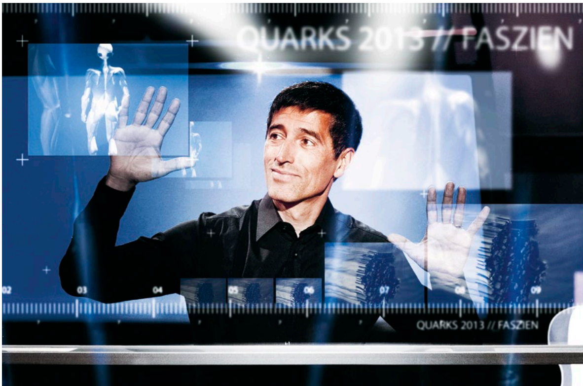
Ranga Yogeshwar moderiert »Quarks & Co« und erklärt in der Sendung »Geheimnisvolle Faszien – Neues vom Rücken« die menschliche Anatomie