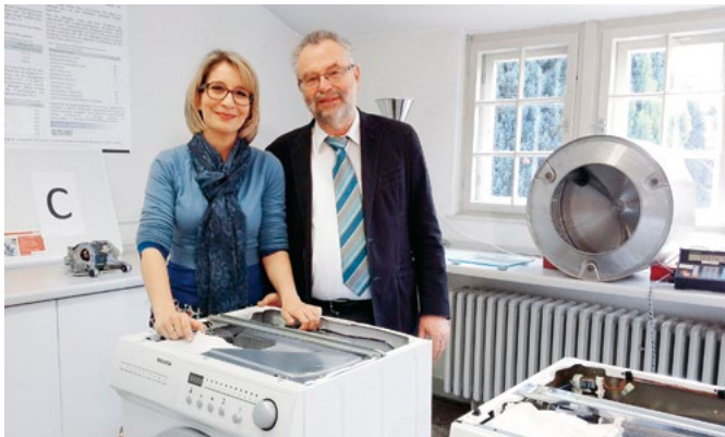
»Der Große Haushaltscheck« mit Yvonne Willicks klärt über Waschirrtümer auf

Die häufigen Lebensmittelskandale machen deutlich: Es geht nicht (nur) um »billiger leben«, sondern auch um »besser leben«. Wir interessieren uns auch für die Herstellungsprozesse von Produkten und fragen nach den sozialen und ökologischen Auswirkungen des Konsums. Es hat sich gezeigt, dass neue unterhaltende und informative Formate wie »Der Vorkoster«, »Haushaltscheck« oder »Marken-Check« ein breites, auch jüngeres Publikum erreichen. Qualität und Quote schließen sich also nicht aus.