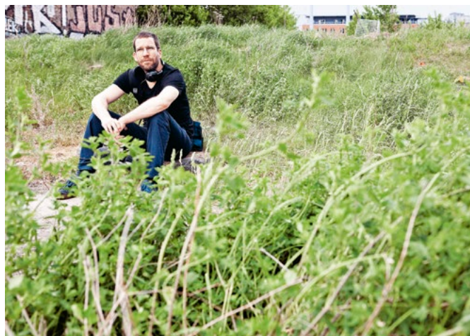
Paul Plampers Audio-Installation »Der Kauf« konnten die Hörerinnen und Hörer auf WDR 3 erleben

Die Herausforderungen der Zukunft anzunehmen heißt vor allem: Den Willen haben, Bestehendes zu überprüfen und Neues zuzulassen und diesem den Raum und die Zeit zu geben, sich zu entwickeln und zu etablieren. Eine junge, spannende Serie zum Beispiel braucht nicht nur einen angemessenen Sendeplatz, sondern auch den langen Atem, sodass dieses Angebot von den Zuschauerinnen und Zuschauern gefunden und erlernt werden kann. Neue Formen und Experimente brauchen finanzielle und personelle Unterstützung, aber vor allem: Mut zum Risiko – und das heißt auch: zum Scheitern. Fehlertoleranz ist wichtig, damit Neues entstehen kann. Nur so kann man neues und neugieriges Publikum gewinnen.