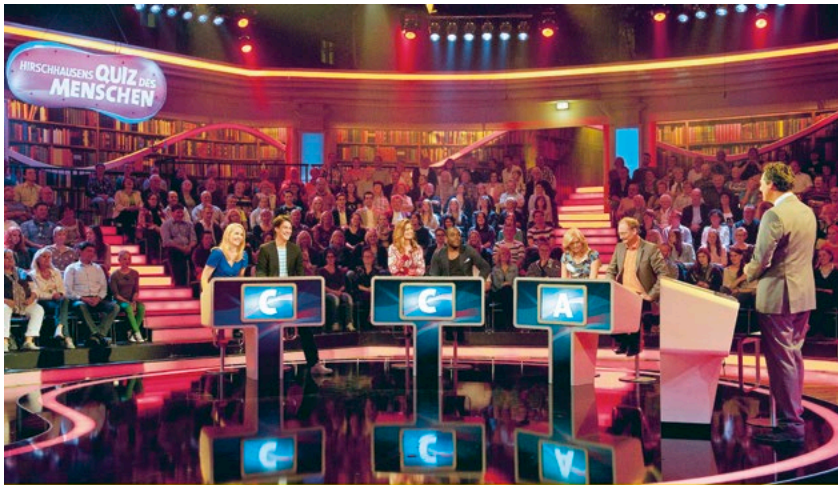
»Das fantastische Quiz des Menschen« mit Dr. Eckart von Hirschhausen (rechts)