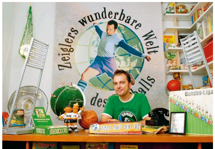
Arnd Zeigler freut sich auf die Anrufe des Publikums in »Zeiglers wunderbare Welt des Fußballs«

Sport und Sportberichterstattung verbinden die Generationen. Es ist eines der ganz wenigen Genres, mit dem gleichermaßen Junge wie Alte erreicht werden können. Es ist daher eine große Herausforderung, durch Themenauswahl und Umsetzung ein möglichst breites Altersspektrum zu bedienen und verstärkt auch das weibliche Publikum zu erreichen. Darüber hinaus setzen wir auch altersspezifische Formate ein. Wir wollen das Interesse junger Menschen am Sport wecken. In der Hörfunkwelle 1LIVE etwa schauen wir mit dem »1LIVE Elfer«, einer interaktiven Sendung mit Lifestylezugang zum Bundesligafußball, aus der Perspektive junger Menschen auf das Sportgeschehen.