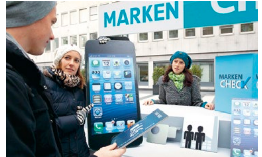
Der »Marken-Check« nimmt Apple unter die Lupe

Die Eilmeldung der Nachrichtenagentur kam an einem Septembertag um 7:07 Uhr: Die US-Bank Lehman Brothers ist pleite. Schon drei Wochen später stand das deutsche Finanzsystem vor dem Kollaps: Nur die »Spareinlagen-Garantie« der Kanzlerin, vor Börsen- und Banköffnung in laufende Kameras gesprochen, verhinderte eine Panik der Sparer oder sogar Schlimmeres. Die Finanzkrise ist bis heute nicht vorbei. Ende März 2013 offenbarte der ARD-Deutschlandtrend, dass sich immer noch 48 Prozent der Deutschen Sorgen um ihre Ersparnisse machen.