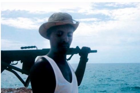
Die Doku »Der Pirat und sein Kapitän« ist Politikum und Psychodrama zugleich