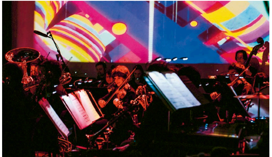
»WRO plays Dubstep«: Das WDR RUNDFUNKORCHESTER Köln interpretiert Titel aus der Dubstepszene