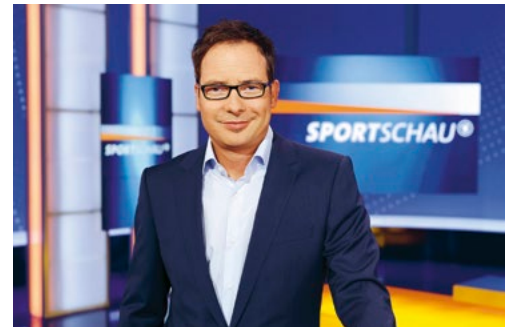
»Sportschau«-Moderator Matthias Opendenhövel

Als öffentlich-rechtlicher Rundfunk berichtet der WDR auch dort, wo kein großes Publi-