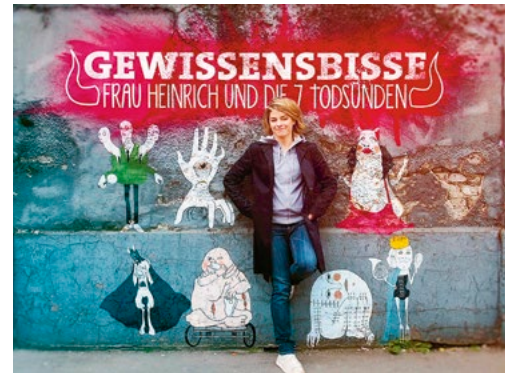
»Frau Heinrich und die 7 Todsünden« ist eine Gemeinschaftsproduktion von Einsfestival und »Planet Schule«

Zu den großen Projekten gehören »Radio 2020« und »tv 20:15«. Eine Projektredaktion entwickelt unkonventionelle Sendungen.