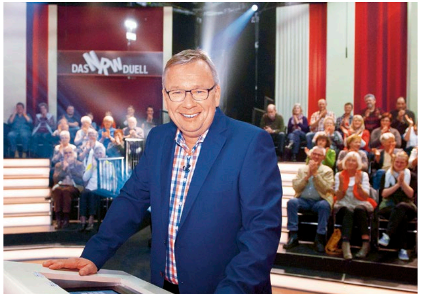
Im »NRW Duell« prüft Bernd Stelter, wie gut sich seine Kandidatinnen und Kandidaten in NRW auskennen

Wir bereiten unsere regionalen Inhalte für Smartphones und Tablets auf. So erreichen wir auch verstärkt jüngeres Publikum. Wir nutzen soziale Netzwerke für den Dialog mit den Menschen, die uns zuschauen und zuhören, sodass sie Impulse für die Programmgestaltung geben können. Dieser direkte Austausch bringt