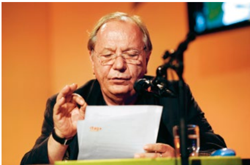
Der Kabarettist Wilfried Schmickler liest beim »WDR 5 Literaturmarathon«

Es gibt mehr als nur eine Kultur. Kulturen sind vielfältig und dynamisch: Alltagskultur und Avantgarde, Hochkultur und Nischenkultur, Subkultur und Popkultur. Neugier genügt als Voraussetzung für Kulturgenuß und gesellschaftliche Teilhabe. Der WDR verpflichtet sich in einer Weise zur kulturellen Bildung, die ein tieferes Verständnis der Vielfalt von Kultur ermöglicht, nicht nur im Hinblick auf Hoch- und Alltagskultur, sondern vor allem in Hinblick auf kulturelle Veränderungen durch Menschen mit Migrationshintergrund.