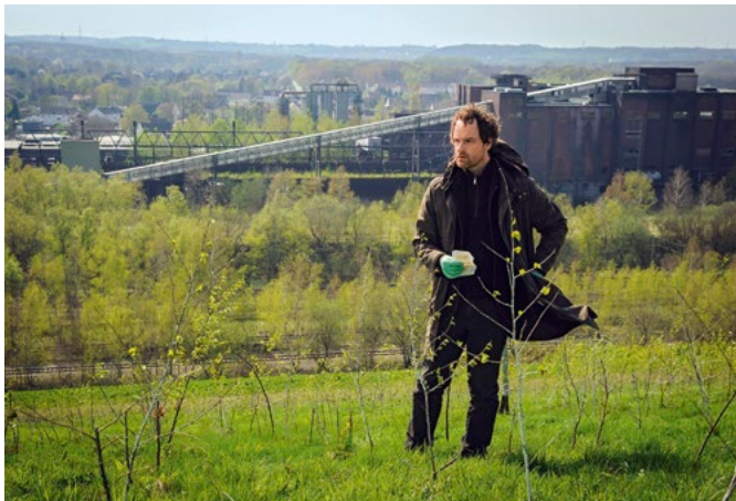
Jörg Hartmann als Peter Faber im »Tatort« aus Dortmund

»Der WDR ist die Plattform, auf der die Menschen in Nordrhein-Westfalen Kultur in allen Spielarten erfahren und genießen können. Mit unseren Sendungen und Veranstaltungen schaffen wir bezahlbare Kultur für alle.«