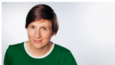
Johannes Büchs führt durch die Sendung »neuneinhalb«