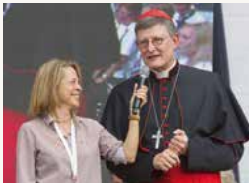
WDR-Journalistin Gisela Steinhauer interviewt Erzbischof Woelki nach seiner Amtseinführung.