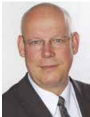
Philipp E. Reichling, WDR-Rundfunkbeauftragter der Katholischen Kirche