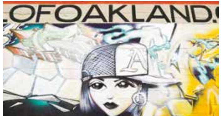
Street-Art in Oakland in der Nähe der Telegraph Avenue.

Oakland liegt gewöhnlich im Schatten von San Francisco, der doppelt so großen Schwesterstadt auf der anderen Seite der Bucht. Seit dem Erfolg von Internet-Unternehmen wie Apple und Google entstand im Silicon Valley südlich von San Francisco ein großer Bedarf an Wohnraum für die wohlhabenden und jungen Mitarbeiter. Die Folge: Viele der Angestellten drängen nach San Francisco und