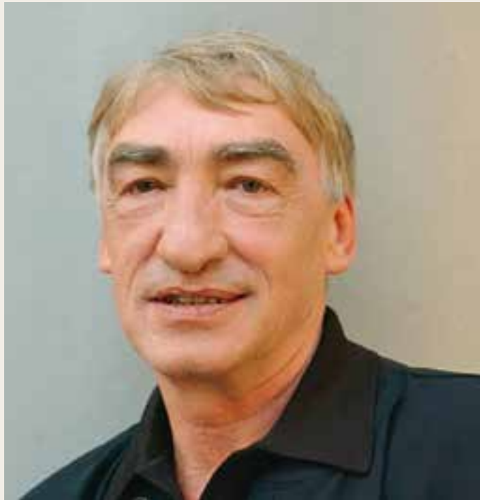
Gottfried Johns Rollen in den Fassbinder-Serien »Acht Stunden sind kein Tag« und »Berlin Alexanderplatz« sind Markierungssteine im deutschen Film.

Gottfried John war dem jungen deutschen Film und dem WDR früh und eng verbunden. So spielte er in den WDR-Filmen