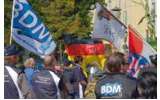
September 2014: Der Bund Deutscher Milchviehhalter demonstriert in Potsdam.

Menschen, die sich gegen einen scheinbar unbesiegbaren Gegner auflehnen – das sind die Helden der fünfteiligen Doku-Reihe »Mut gegen Macht«. Die Kooperation verschiedener WDR-Redaktionen unter Federführung von »Menschen hautnah« ist der Kern eines crossmedialen Projekts rund um den Kampf „David gegen Goliath“.