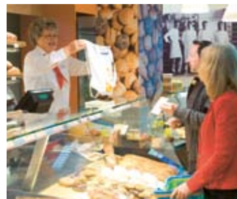
Auch der Einkauf bestimmt die Müllmenge.

Gleich in die Vollen geht das neue Wirtschaftsformat des WDR Fernsehens, das uns alle vor die Gewissensfragen stellt: »Darf ich ... oder darf ich nicht?« Zum Beispiel Tiere essen? Kleine Kinder zu Hause betreuen? Oder wie die Frage der Startsendung lautet: „Darf mir Müll egal sein?“ Um Antwort wird gebeten. Kamera ab!