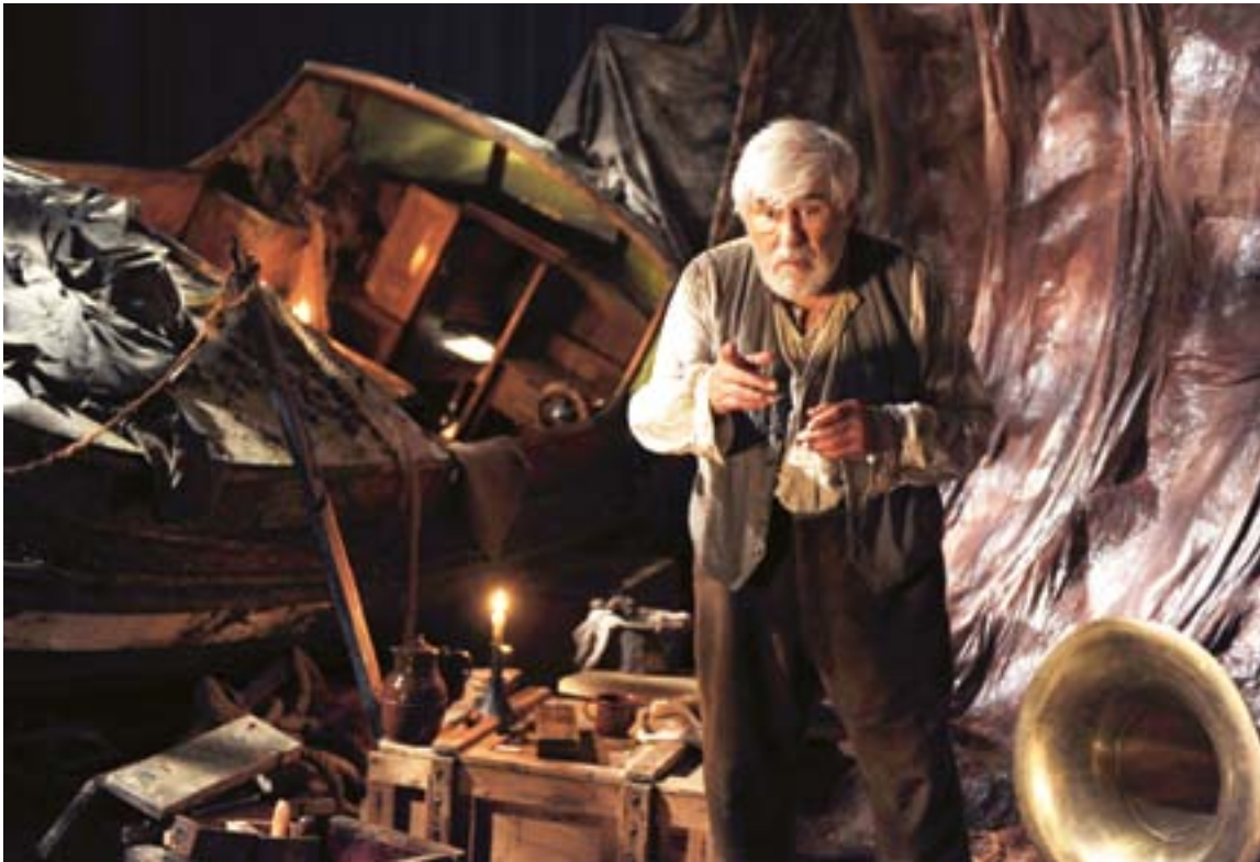
Mario Adorf in einer weiteren großen Rolle. Der Event-Zweiteiler „Pinocchio“ wird im Weihnachtsprogramm ausgestrahlt.