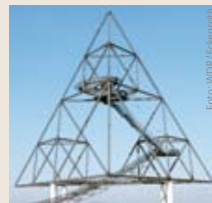
Das Tetraeder in Bottrop

Wir haben früher viel Spaß miteinander gehabt, als er noch WDR-Intendant war. Als Vorsitzender der Kulturhauptstadt 2010 in Essen hat er mich dann ein bisschen enttäuscht mit diesem Spruch von der „Metropole Ruhr“. Das Ruhrgebiet ist keine Metropole, die Ruhris sind viel bescheidener, die wollen auch gar nicht Metropole sein. Darüber kann ich mit ihm gerne mal diskutieren. Und darüber, ob man nun aus jedem Ort, wo mal ein Bergmann hingepinkelt hat, ein Kulturzentrum machen muss. In Bottrop hat man ein altes Zechengebäude wieder zu einem Industriegebäude gemacht. Da sitzen Leute, die Computer produzieren, Bilderrahmen und Vasen herstellen und alle ganz gut davon leben. Wir brauchen Kultur, aber auch Arbeitsplätze. Die Fragen stellte Christian Gottschalk