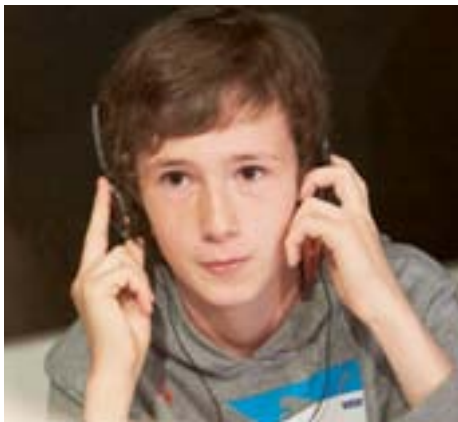
Tim (13) war Moderator. Ihn hat überrascht, dass vieles im Radio nicht so spontan ist, wie es sich anhört. Trotzdem hat es Spaß gemacht, vor dem Mikrofon zu stehen und er könnte sich diesen Beruf vorstellen. „Moderator sein wäre bestimmt lustig. Und das wollte ich auch unbedingt machen im Studio Zwei.“

Erleben, wie Fernsehen gemacht wird. Oder Radio. Einmal vor oder hinter dem Mikro, vor oder hinter der Kamera arbeiten. Diese Möglichkeit haben 12- bis 19-Jährige im neuen WDR Studio Zwei.