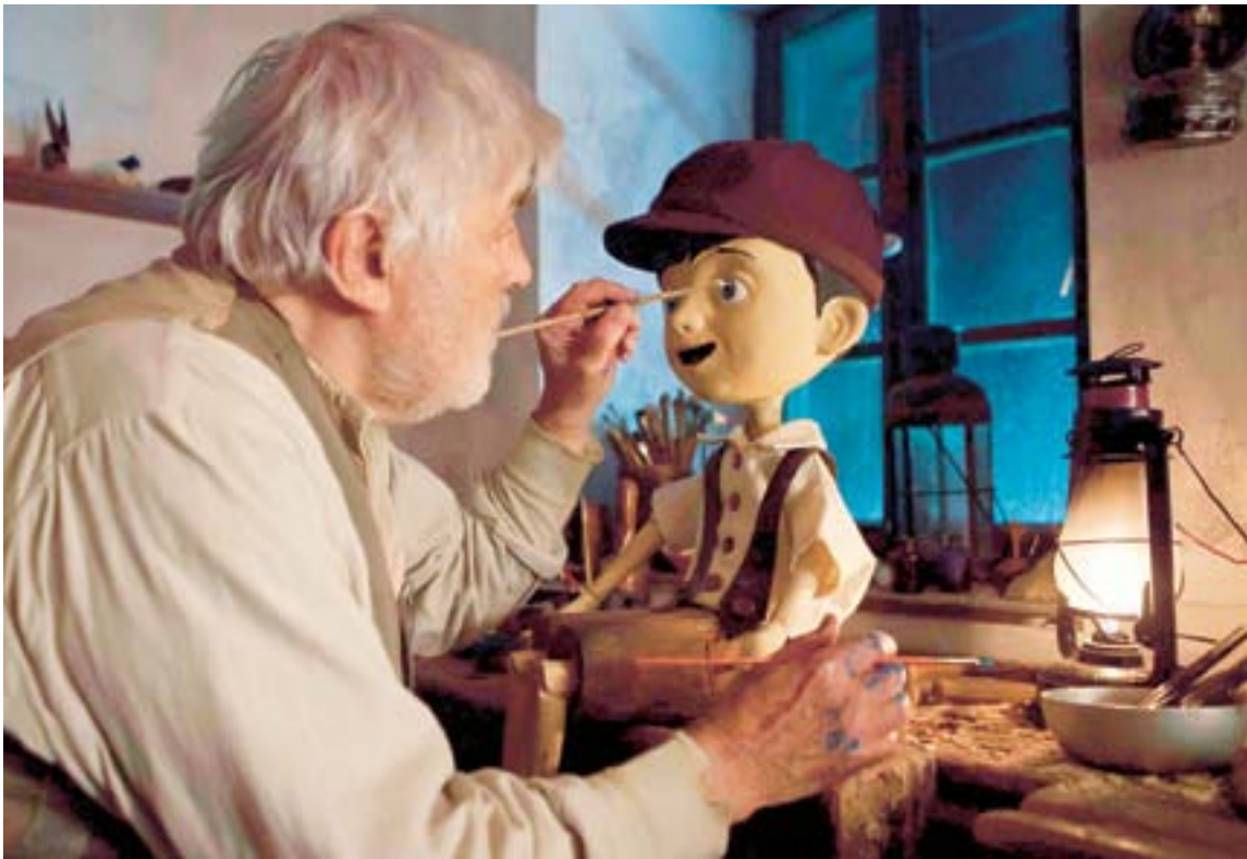
Die Filmbilder der weltberühmten Holzpuppe entstehen am Computer.

Meister Geppetto hat Fieber. Schweiß läuft ihm übers Gesicht, Alpträume quälen ihn. Unruhig wirft er sich – in eine schmutzige Decke gehüllt – hin und her. Kein Arzt kann ihm helfen, denn Geppetto ist im Bauch eines riesigen Fisches, der ihn auf dem offenen Meer zusammen mit seinem Schiff verschluckt hat. Hier unten ist es düster, feucht und riecht nach verwestem Seetang. Die Chancen, in dieser Umgebung gesund zu werden, stehen schlecht.