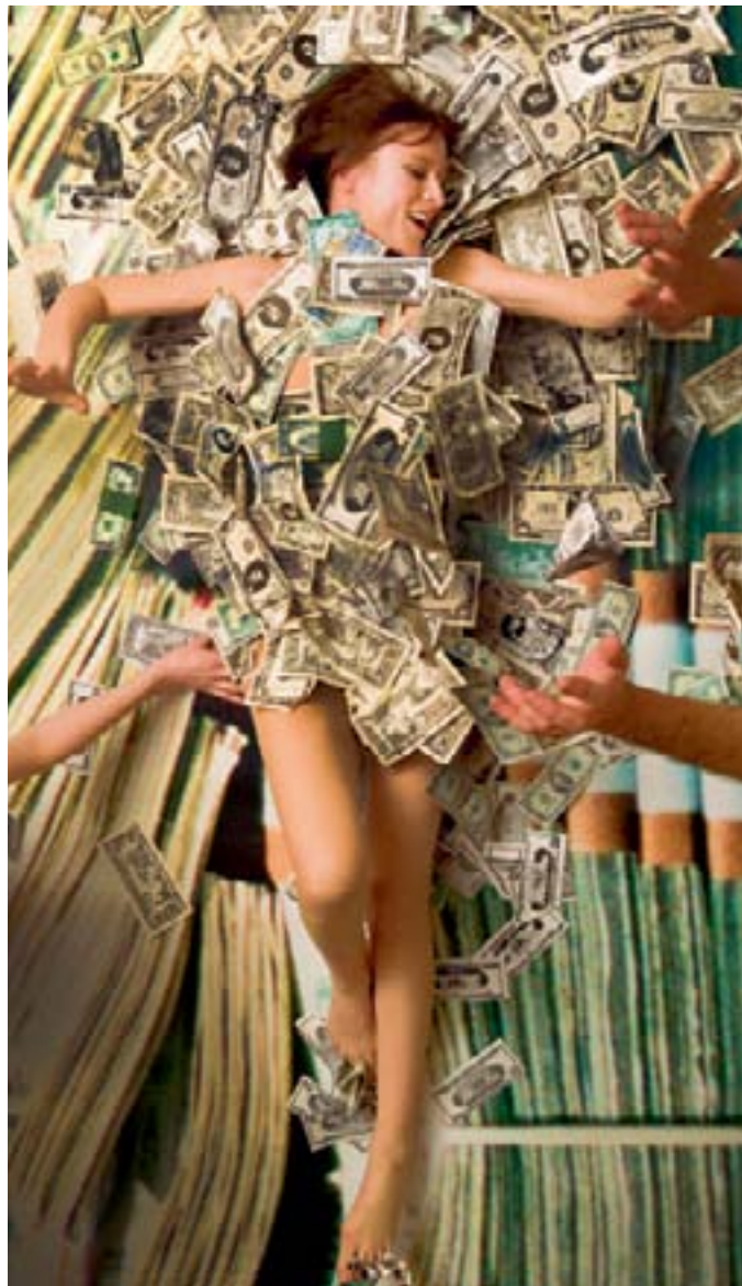
Macht Geld sexy? Sophie Rois