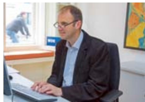
Laan Copes van Cattenburch 44 im Herzen Den Haags, seit anderthalb Jahren sein Arbeitsplatz.

In Den Haag liegen die Geschichten tatsächlich auf der Straße – oder im Sand des benachbarten Nordseestrandes von Scheveningen. Für einen Korrespondenten wäre es geradezu fahrlässig, im Sommer ohne Aufnahmegerät ans Meer zu radeln. Er könnte die Entstehungsgeschichte fantastischer Sandskulpturen verpassen oder das tragische Ende eines niederländischen Wahrzeichens. Der Pier war jahrzehntelang das Scheveninger Postkartenmotiv schlechthin. Mittlerweile