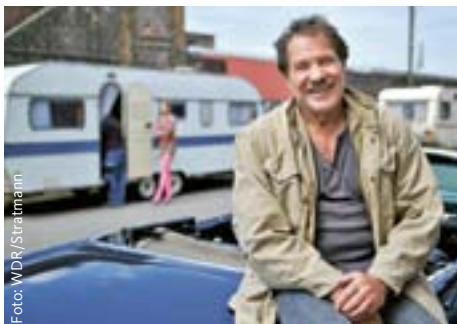
Dreharbeiten in Duisburg: Götz George geht auch mit 74 als Horst Schimanski auf Verbrecherjagd.

Doch zuerst wird Geburtstag gefeiert. George wird am 23. Juli 75. Das Erste zeigt den Ausnahmeschauspieler am 24. Juli um 21:45 (nach dem Duisburger »Tatort« „Schuld und Sühne“) in einer ganz