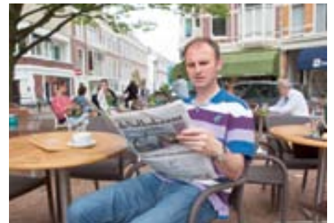
Ein „lekker kopje koffie“ am Anna-Paulowna-Platz – der ideale Ort für die Zeitungslektüre

In Den Haag sind die niederländische Politik, die Monarchie und die Weltjustiz zu Hause. Der Internationale Gerichtshof im imposanten Friedenspalast, das Jugoslawien-Tribunal am Stadtrand zu Scheveningen und der noch recht junge Strafgerichtshof an der A12 haben hier ihren Sitz. Jede andere europäische Metropole würde sich unter solchen Umständen abschotten und einigeln. Den Haag nicht. Die 500 000 Einwohner zählende Residenzstadt bleibt bodenständig und weltoffen