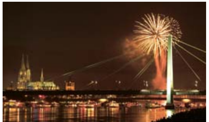
Der WDR setzt am 13. Juli das größte musiksynchrone Feuerwerk Deutschlands und den Konvoi aus mehr als 50 festlich beleuchteten Schiffen telegen in Szene – die größte alljährliche Fernsehproduktion.

ken und Martin von Mauschwitz moderieren das Spektakel am 13. Juli von 20:15 bis 0:00 fürs WDR Fernsehen. Die Reporterinnen und Reporter berichten live von der MS RheinEnergie, dem größten Partyschiff auf dem Rhein, der MS Ruhr, dem Aufsichtsschiff des Wasser- und Schifffahrtsamtes, aus dem Rheinpark, vom Tanzbrunnen und vom Kölner Ruderverein in Rodenkirchen. mal