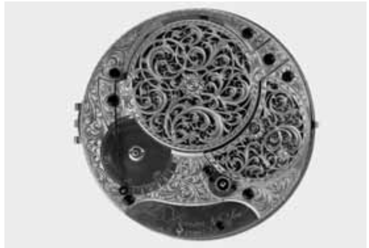
Die Schiffsuhr H4 revolutionierte die Navigation in der Welt der Seefahrer.

Jahren ein globales Problem ersten Ranges, denn die Seefahrernationen kämpften gerade um die Vorherrschaft auf den Weltmeeren. 1714 hatte die englische Krone deshalb ein enormes Preisgeld ausgesetzt. Dabei war die Sache ganz simpel: Der Zeitunterschied zwischen Heimathafen und aktueller Position legt den Längengrad fest. Nur, wo die Zeit ablesen? Seegängige Schiffsuhren gab es nicht, also macht sich der englische Uhrmacher John Harrison an den Bau. Die Astronomen dagegen wollten die Zeit am Himmel ablesen, mit dem Mond als Zeiger und den