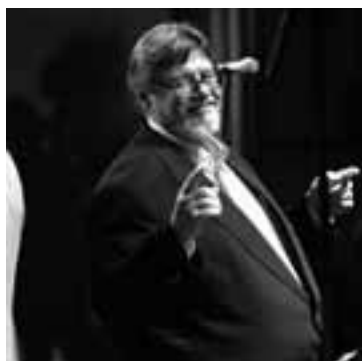
Peter Herbolzheimer