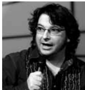
Hennes Bender präsentiert einige der besten Vertreter von Kabarett und Comedy.

Mit Hennes Bender Die Mischung macht es: Politisches Kabarett, schnelle Comedy und schräges Musikkabarett präsentiert das WDR-Kabarettfest aus dem Ebertbad in Oberhausen. Gastgeber Hennes Bender begrüßt mit Ingolf Lück einen der schillerndsten Entertainer der Republik. In seinem Solo persifliert Lück den täglichen Spagat zwischen liebendem Familienvater