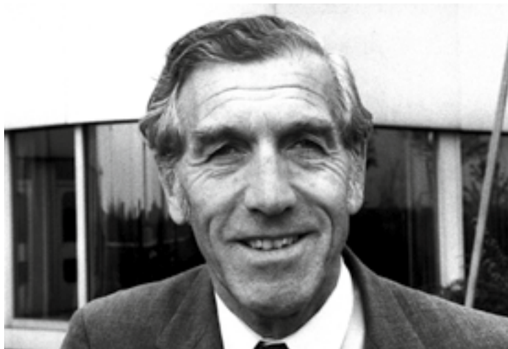
Paul Watzlawick: Halbvoll oder halbleer? Das ist hier die Frage.

Dieser radikale Konstruktivismus lieferte den theoretischen Rahmen für Watzlawicks Kommunikations- theorie und seine daraus entwickelte Kurzzeittherapie. Die langwierige Ursachenforschung in der Kindheit hielt er für Zeit- und Geldverschwen-