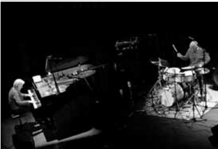
Die Pianistin Irène Schweizer und der Percussionist Pierre Favre spielen seit 1966 zusammen.