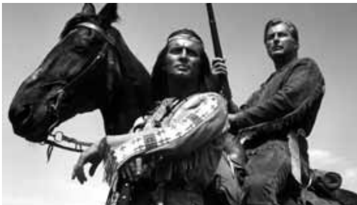
Das Revival des Karl May: die Winnetou-Verfilmungen mit Pierre Brice (li.) und Lex Barker