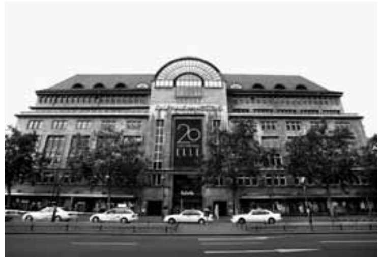
Renommierter Konsumtempel: das KaDeWe in Berlin

Werbefernsehen von ARD und ZDF, aber auch durch die Versandhaus-Kataloge von Otto und Quelle, die unter der Hand im Arbeiter- und Bauernstaat kursierten. Die Inter-shops im Lande heizten die Versuchung weiter an. Die Ernüchterung folgte beim nächsten Einkauf im Konsum oder HO, den staatlichen Läden der DDR. Was es gab, war nicht verlockend und was verlockend war, gab es nicht. Wie schön wäre da doch ein riesiges, buntes „Kaufhaus des Westens“. Das Kaufhaus freilich gab es schon lange – seit dem 27. März 1907 am Wittenbergplatz