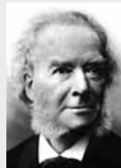
Carl Reinecke