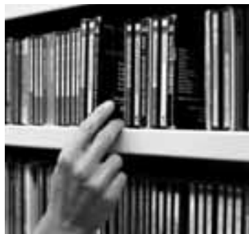
Das CD-Regal: Eine aussterbende Gattung.

Hörerinnen und Hörer können sich über das kostenlose WDR 5 Hörertelefon 0800 5678 555 live an der Sendung beteiligen. Redaktion Katrin Paulsen