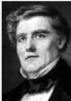
Carl Loewe