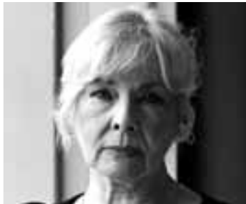
Annekathrin Bürger wird 75 Jahre alt.