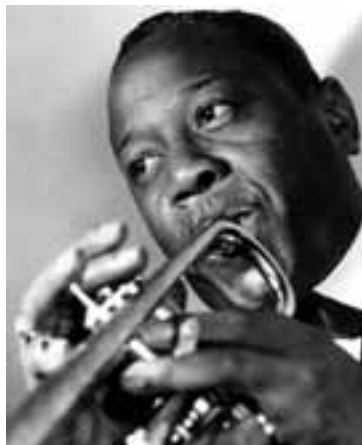
Roy Eldridge: Hochmusikalisch und technisch perfekt.