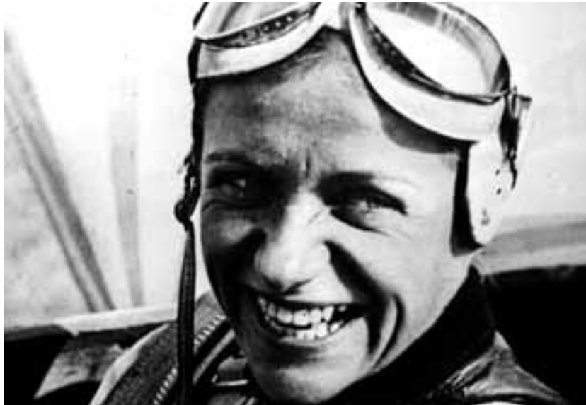
Hanna Reitsch – eine der größten Fliegerinnen ihrer Zeit – aber auch Anhängerin des Nationalsozialismus.