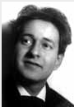
Erich Wolfgang Korngold