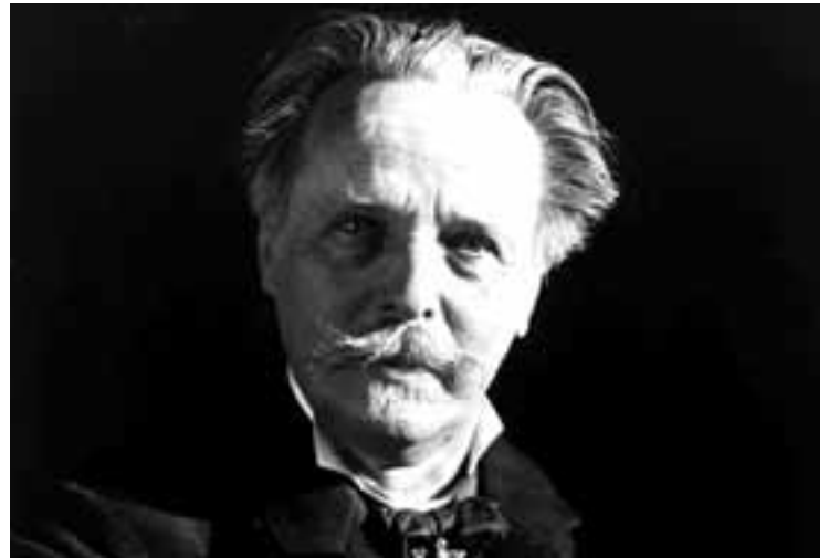
Karl May: Man nannte ihn Lügner, Betrüger – oder, wie Arno Schmidt, einen „Großmystiker“.

schreibt und die Grenze zwischen seiner privaten Existenz und der Rolle als Old Shatterhand soweit auflöst, dass Realität und Fiktion nicht mehr zu unterscheiden sind. Gegen Ende seines Lebens – eine Zeit phänomenaler Triumphe liegt hinter ihm – wirft man ihm vor, ein Lügner, ein Betrüger, ein Verderber der Jugend zu sein. Der Fluch der eigenen Jugend scheint ihn einzuholen, als er wegen kleiner Gaunereien Gefängnisstrafen abzusitzen hatte. „Ein Greenhorn kauft Schießpulver und wenn er den ersten