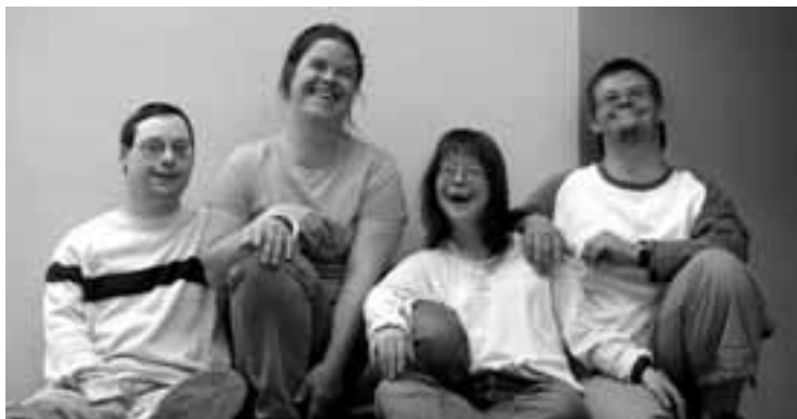
Junge Menschen mit Down-Syndrom: Veränderte gesellschaftliche Wahrnehmung durch verbesserte Medizin?

Von Beate Weides Down-Syndrom. Wann immer eine schwangere Frau über vorgeburtliche Untersuchungen nachdenkt, steht dieser Begriff im Raum. Man denkt dabei an Kinder mit mandelförmigen Augen und gedrungener Gestalt. Behindert, aber fröhlich. Aber wie sind Menschen mit Down-Syndrom wirklich? Wie werden sie in einer Gesellschaft wahrge-