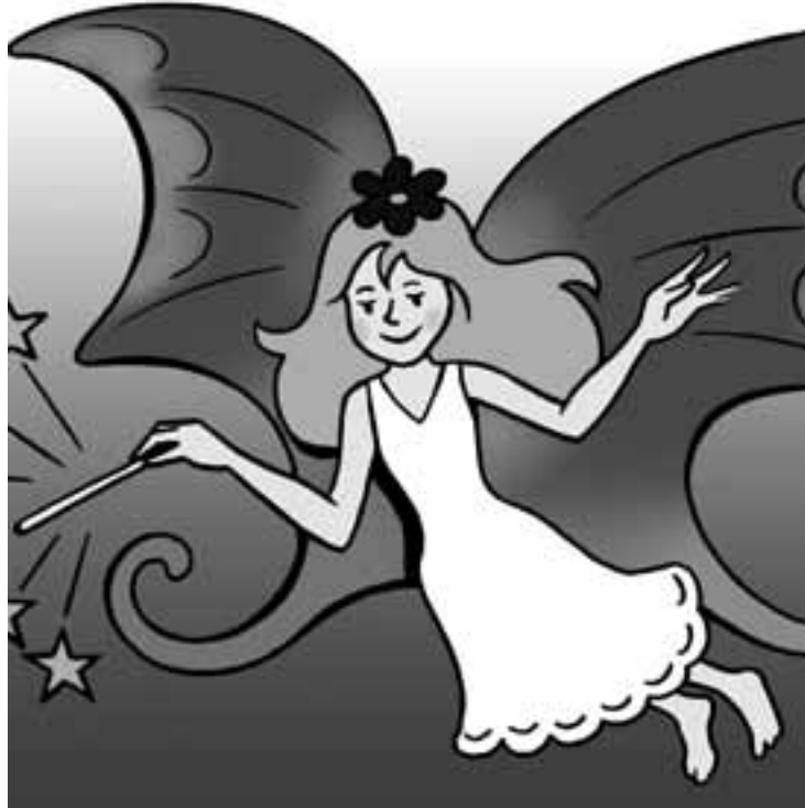
Hach, das wäre doch schön, wenn eine kleine Fee vom Himmel schwebte und sagte: „Du darfst Dir was wünschen!“ Darum geht es heute in der Bärenbude um 19.30 Uhr auf WDR 5: Wenn ich einen Wunsch frei hätte ...

09:20 WDR 5 – Tagesgespräch Wiederholung Freitag 04:05