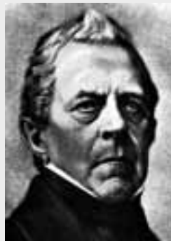
Franz Berwald