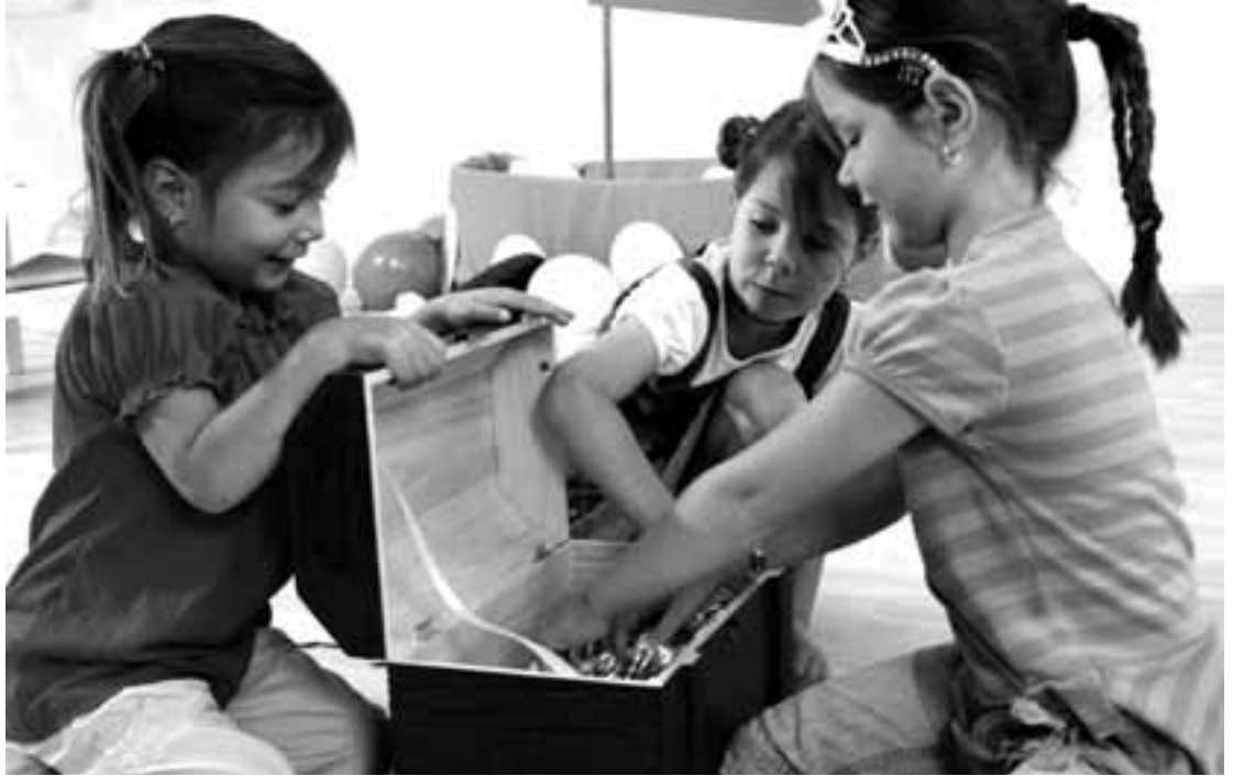
Eine riesige Kiste voll mit spannenden Sachen – das wäre ein großer Schatz. In der Bärenbude auf WDR 5 wird heute um 19.30 Uhr einer gehoben – das wird aufregend!

TIPP ▶ Stichtag heute: 01. April 1612 Lord Thomas West