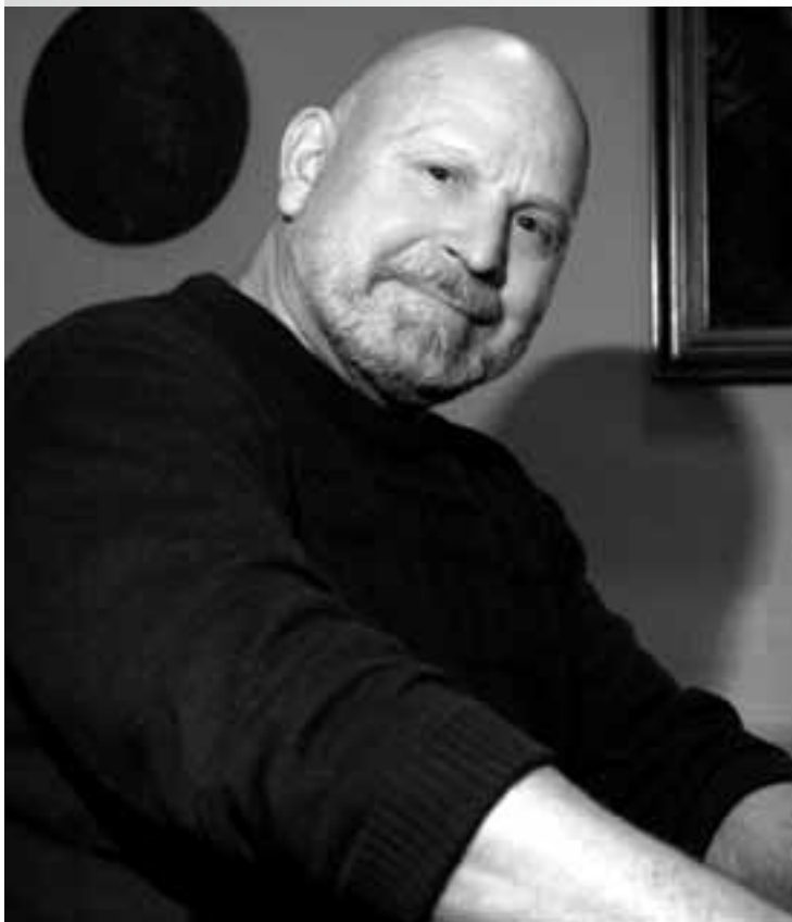
Peteris Vasks' „Musica dolorosa“ steht u. a. heute auf dem Programm.