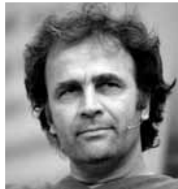
Der Schweizer Autor Alex Capus

Capus wurde 1961 als Sohn eines Franzosen und einer Schweizerin in der Normandie geboren. Seine ersten fünf Lebensjahre verbrachte er in Paris, zog dann mit seiner Mutter in die Schweiz. Er wohnt immer noch dort, wo er als Kind zur