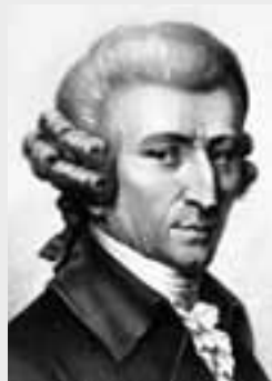
Joseph Haydn

Konzert d-moll, BWV 1052; Deutsche Kammerphilharmonie Bremen, Klavier und Leitung: David Fray Marc-Antoin Charpentier Cinq Méditations pour le carême; Le Concert Spirituel