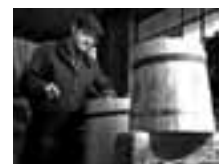
Handgemachtes, zum Beispiel diese Bottiche, hat Konjunktur.