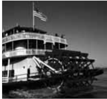
Nicht mit dem Raddampfer, aber literarisch reist die SpielArt heute den Mississippi hinunter.

Von Thomas C. Breuer Die Hörer schippern mit der SpielArt den Mississippi hinunter in Richtung