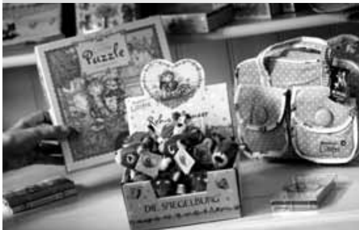
Die neuen Verlagsprogramme: Accessoires statt Bücher.