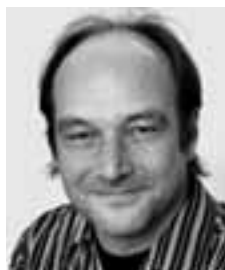
Thomas Leutzbach führte Regie in der Produktion von „Krieg der Schatten“.