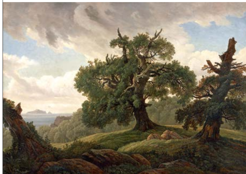
Carl Maria von Weber wurde in Eutin geboren, gut zehn Kilometer entfernt von der Ostseeküste. Unweit davon schuf Carl Gustav Carus (1789–1869) seine »Eichen am Meer«. Untertitel dieses Gemäldes von 1835: »Erinnerung an eine bewaldete Insel der Ostsee«