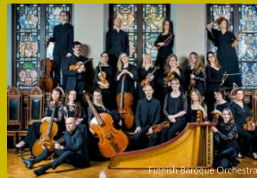
Finnish Baroque Orchestra

Kulturaustausch im 18. Jahrhundert: Beim Haydn-Festival der Brühler Schlosskonzerte beleuchtet das Finnish Baroque Orchestra die musikalischen Verbindungen zwischen Westeuropa und dem russischen Zarenhof.