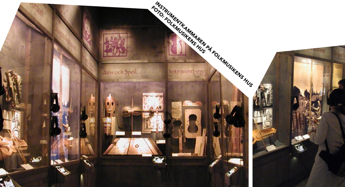
INSTRUMENTKAMMAREN PÅ FOLKMUSIKENS HUS

Folk Music House is Dalarna's folk music center, firmly rooted in a rich folk music environment and with a broad outlook. Its purpose is to spread knowledge and interest in folk music and dance, both as exciting history and as a creative part of the contemporary music scene. Activities include exhibitions, concerts and dances, education, archive services, audio migration and IT development. The store has a large assortment of CDs, sheet music and literature, and serves as an information hub for folk music and dance.